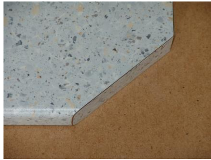
Dickkante über Abschrägung 25,00 €