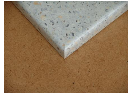
Postformingkante einsetzen 90° 40,00 € zzgl. Material für Postformingkante (29,00 €/lfm)