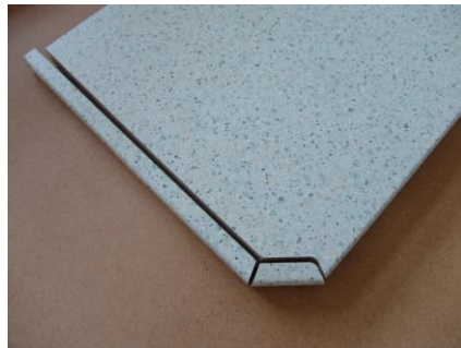
Postformingkante einsetzen über Abschrägung 60,00 € zzgl. Material für Postformingkante (29,00 €/lfm)